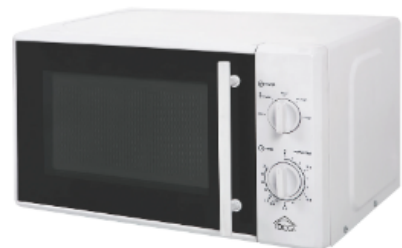
IL (FORNO A) MICROONDE