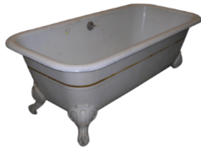
LA VASCA DA BAGNO